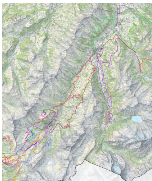
Auszug Kartendarstellung Mountainbike-Richtplan 2024

Um den Umsetzungsprozess zu unterstützen, haben die Berg- und Planungsregionen teilregionale Workshops und Koordinationstreffen organisiert, um offene Fragen in Bezug auf die Umsetzung aufzugreifen und zu diskutieren. Dabei zeigte sich, wie wertvoll und vorausschauend frühere Aktivitäten wie die Schaffung einer Mountainbike-Haftpflichtlösung waren: Alle Grundeigentümer:innen, auf deren Land sich Routen des Regionalen Mountainbikerichtplans befinden, geniessen bereits heute Versicherungsschutz.